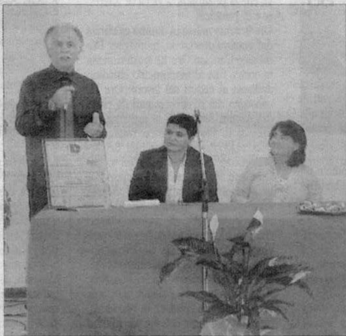
Dopo di noi Cerimonia di consegna dell'appartamento alla "casa verde" per la vita comune e autonoma dei ragazzi down